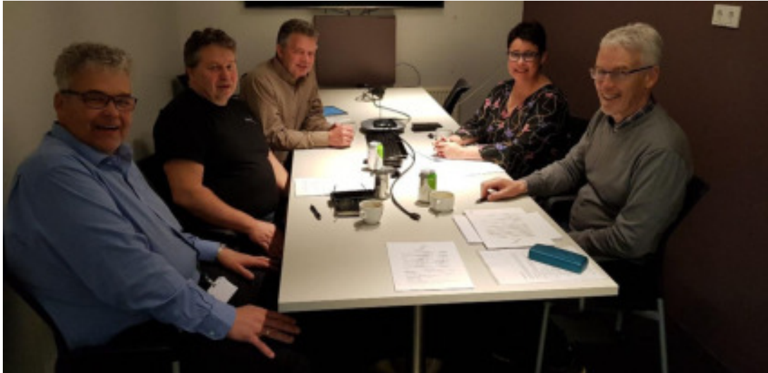
Frá undirritun kjarasamnings Samiðnar og Sambands garðyrkjubænda, 2019

hagsmunaaðilar í garðyrkju til þessa reynt að styðja skólann og starfsmenntanámið, m.a. með þátttöku í viðburðum, hagnýtum tilraunum og samstarfsverkefnum, með því að tala máli skólans við löggjafar- og fjárveitingavaldið, auk þess sem fólk og félög á vettvangi garðyrkjunnar hafa gefið gjafir til skólans og útskriftarnemenda. Nú hafa samskipti atvinnulífs og skólans hins vegar þróast með þeim hætti að ekki verður lengra haldið á þeirri vegferð og brýnt er að starfsmenntanámið öðlist frelsi frá LBHÍ svo núverandi ástand skaði ekki námið og atvinnugreinina meira en orðið er.