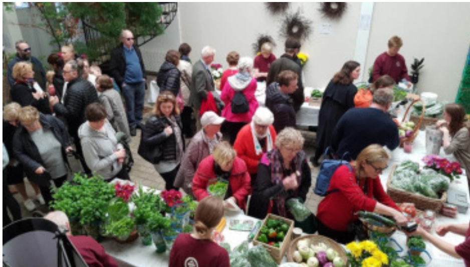
Það er að jafnaði glatt á hjalla að Reykjum á sumardaginn fyrsta

Ekki þarf að fjölyrða um hversu alvarleg þessi staða er gagnvart náminu og framtíð þess, nemendum og atvinnugreininni í heild.