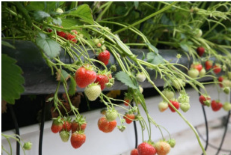
Íslensk jarðarber eru nú á boðstólnum stærri hluta ársins en áður var

„Ríkisstjórnin vill tryggja framhaldsskólum frelsi og fjármagn til eigin stefnumótunar innan ramma framhaldsskólalaga og kanna kosti sveigjanlegra skólaskila. Ráðist verður í stórsókn í uppbyggingu hjúkrunarrýma. Ríkisstjórnin ætlar að leggja sérstakra áherslu á listnám og aukna tækniþekkingu sem gera mun íslenskt samfélag samkeppnishæfara á alþjóðavísu. Iðnnám og verk- og starfsnám verður einnig eft í þágu fjölbreytni og öflugra samfélags. Jafnt aðgengi að námi óháð búsetu og öðrum aðstæðum verður meginmarkmið. Endurskoða þarf löggjöf um framhaldsfræðslu og setja skýran ramma um starfsemi menntastofnana og samstarf við atvinnulífð“.