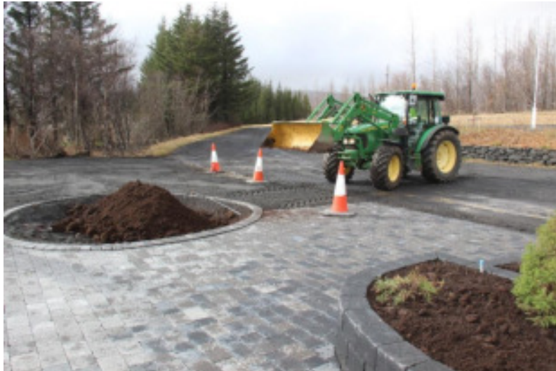
Skrúðgarðyrkja er löggilt iðngrein. Fagið er mikilvægur hlekkur í uppbyggingu þéttbýlis og borgarsamfélaga

Eftir 15 ár liggur ljóst fyrir að sameining starfsmenntanáms í garðyrkju við LbhÍ er tilraun sem misheppnaðist. Eðlilegt er að umræður um framtíðarskipan starfsmenntanáms í garðyrkju, sem er á framhaldsskólastigi, fari fram milli menntamálayfirvalda og atvinnugreinarinnar án afskipta einstakra háskólastofnana eða annarra rekstareininga.